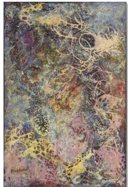
Milky Way , 1945

Milky Way is in 2022 tentoongesteld in het MOMA in New York.