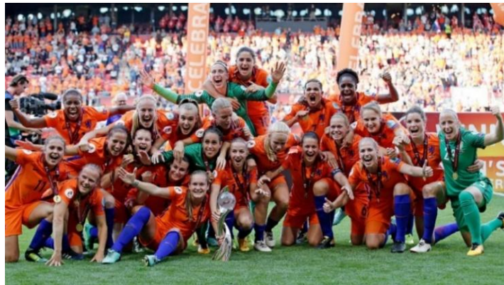
2017: voor het eerst in de geschiedenis zijn de Oranjevrouwen Europees kampioen

1924: Eerste officiële Nederlandse vrouwenvoetbalvereniging