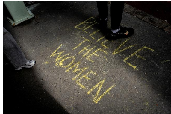
Believe the Women, op de stoep bij de Trump Tower op Internationale Vrouwendag 2026